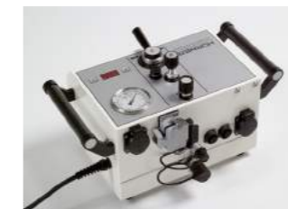
Alle Anschlüsse auf der Gehäuserückseite